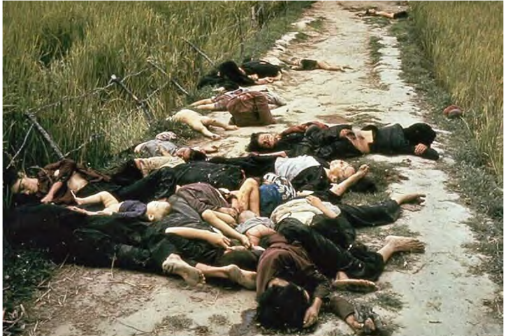
Bild: My Lai Massaker

Interessanterweise wurde die USS Pueblo an der Ostküste Nordkoreas gekapert, liegt aber nun in Pyeongyang. Die Nordkoreaner haben also das Schiff ungehindert einmal rund um die koreanische Halbinsel befördert. Die gefangenen US-Spionageboys waren in nord-koreanischer Gefangenschaft gewiss besser aufgehoben, als ihre Kollegen während der Tet-Offensive in Vietnam im gleichen Jahr, die sich zudem noch in My Lai austobten. Auch daran erinnert man sich in Nordkorea